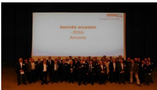
L'équipe réunie lors de la dernière journée occasion chez Manitou Novembre 2016

Argus-chariot, c'est avant tout une équipe en perpétuelle quête de nouveaux acteurs, d'amélioration, et d'expansion. Un comité de pilotage, des administrateurs, des développeurs, des réseaux de cotateurs se réunissent régulièrement pour faire vivre l'aventure argus et la pérenniser. Leur prochain grand rendez-vous est la « Journée Occasion 2017 », qui se tiendra à Lille, courant novembre, chez Exide Technologies.